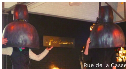
Rue de la Casse